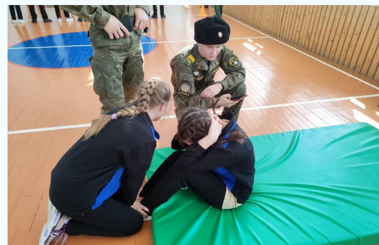
Школьная спартакиада „Вперед, кадеты“